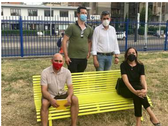
Panchina Gialla contro il bullismo presso il Parco di San Donato