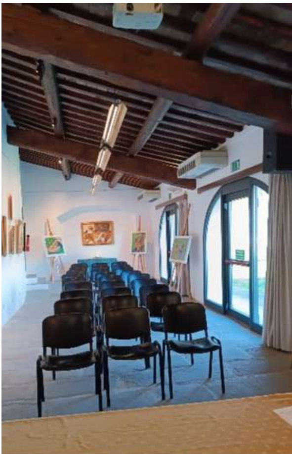
Sala Archi di Villa Pozzolini