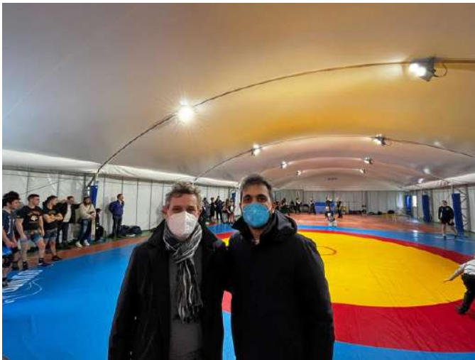
Palestra Isis Da Vinci