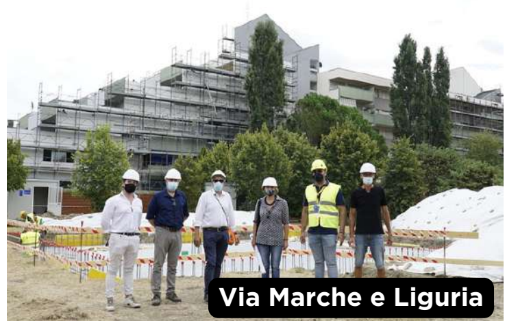
Via Marche e Liguria