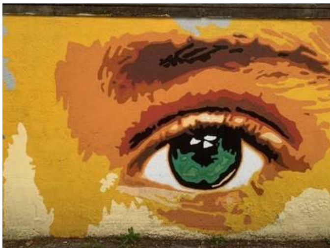
Via del Terzolle