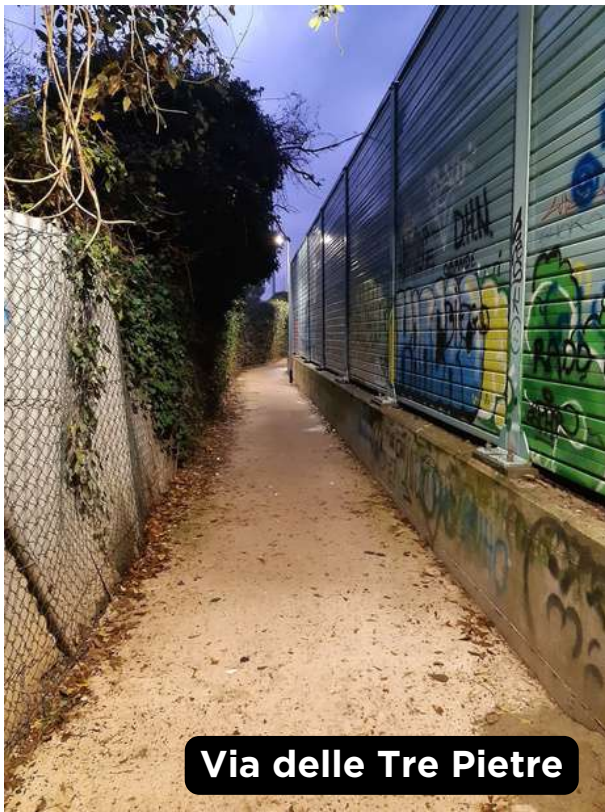
Via delle Tre Pietre