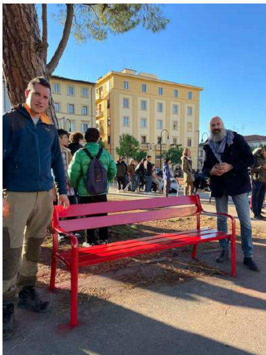
Molte le panchine rosse contro la violenza sulle donne situate nel Quartiere

Per consultare la mappa delle panchine tematiche presenti nel Quartiere 5 ecco il QR: