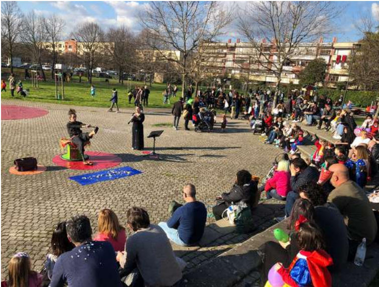
Il Carnevale nel Quartiere