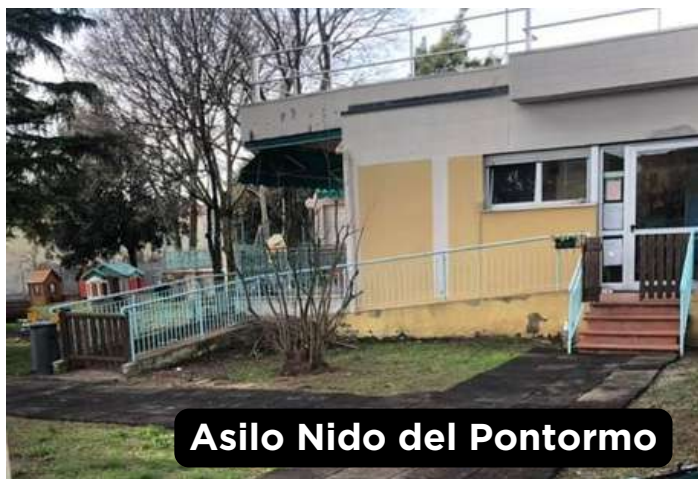
Asilo Nido del Pontormo

Grandi e rinnovati spazi per i più piccoli