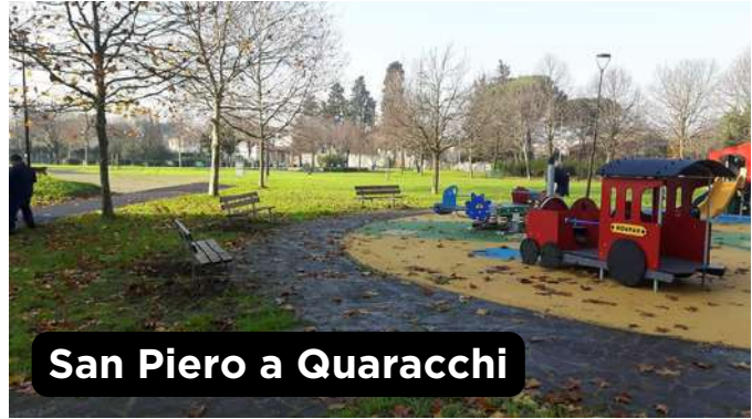
San Piero a Quaracchi