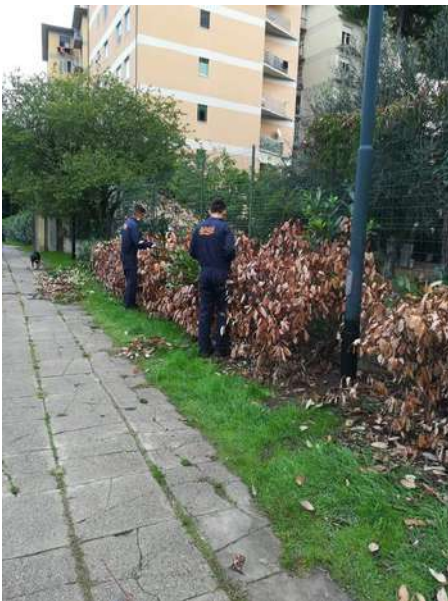
Progetto Oltre (Giustizia riparatoria)

Murale Corto Piaggese composto da sei “quadri” con frasi significative. Riveste le pareti del centro commerciale le Piagge