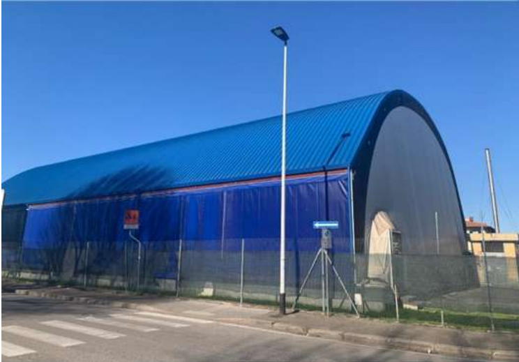
Nuova palestra in via Lombardia