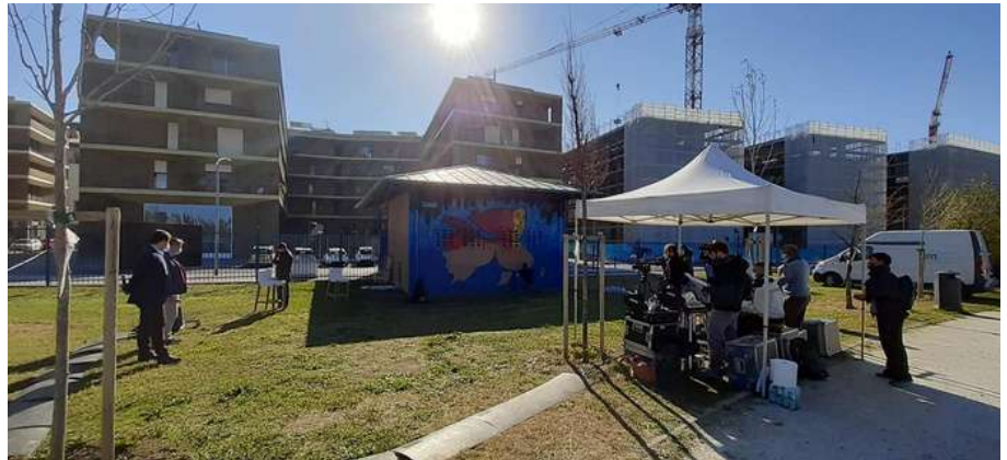
Poster Art in omaggio alle figure di donne che hanno ispirato ed ispirano le nuove generazioni, in un'ottica di empowerment femminile