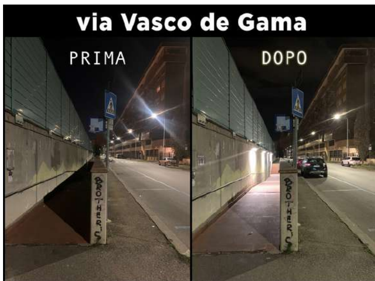
via Vasco de Gama