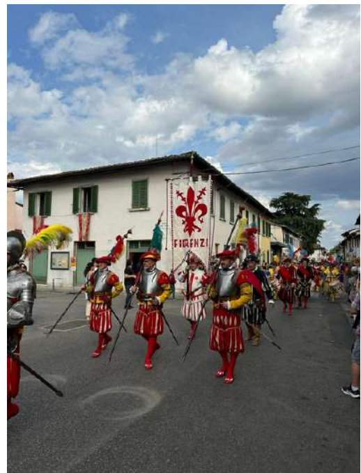
Festa Medievale a Brozzi