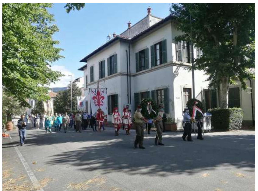
Commemorazione della strage di Castello