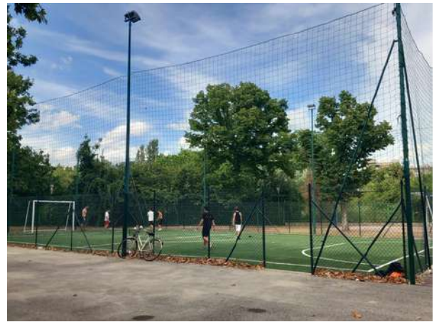
Campo Caterina de' Medici