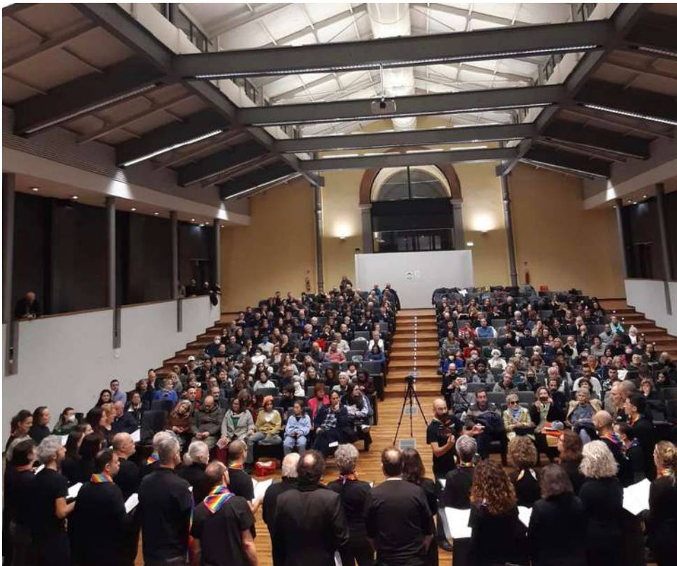
Il Concerto dei diritti presso l'Istituto Comprensivo Ottone Rosai