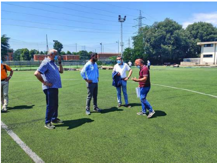
Campo Manlio Rebecchi