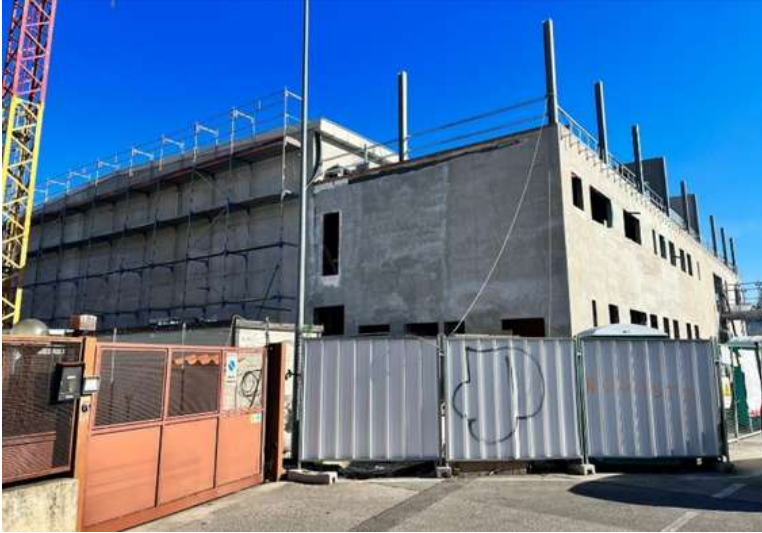
Nuovo palazzetto dello sport di via Geminiani