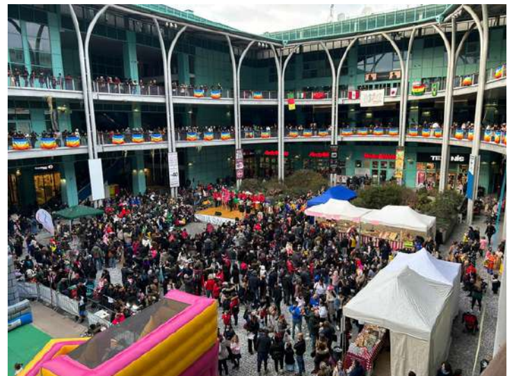
Carnevale di Pace