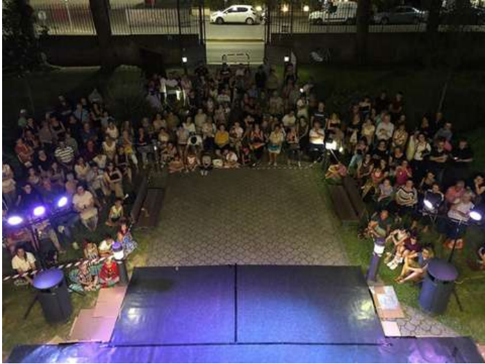
Estate a Pallini

Veramente tanti gli eventi, gli spettacoli, le manifestazioni che hanno animato il Quartiere