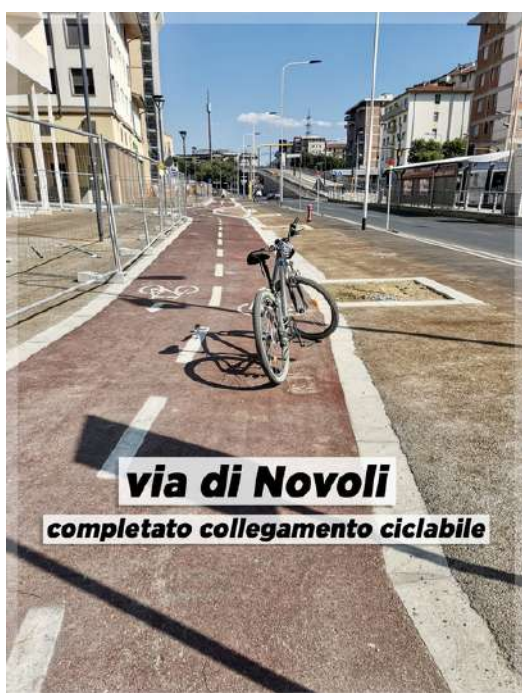
via di Novoli completato collegamento ciclabile