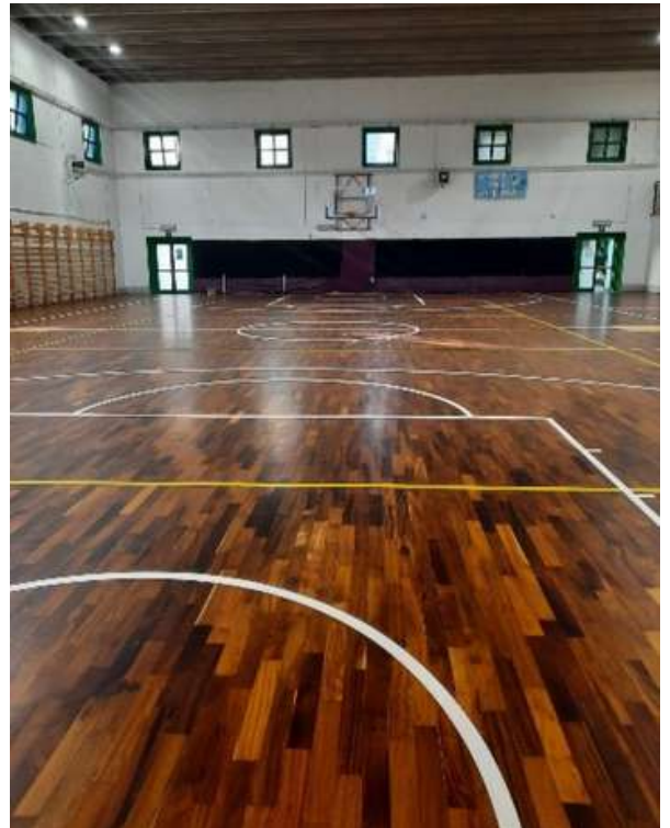
Nuovo parquet della palestra della scuola Vamba