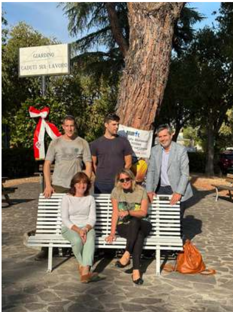
Panchina Bianca in ricordo delle vittime sul lavoro presso il Giardino Caduti sul lavoro