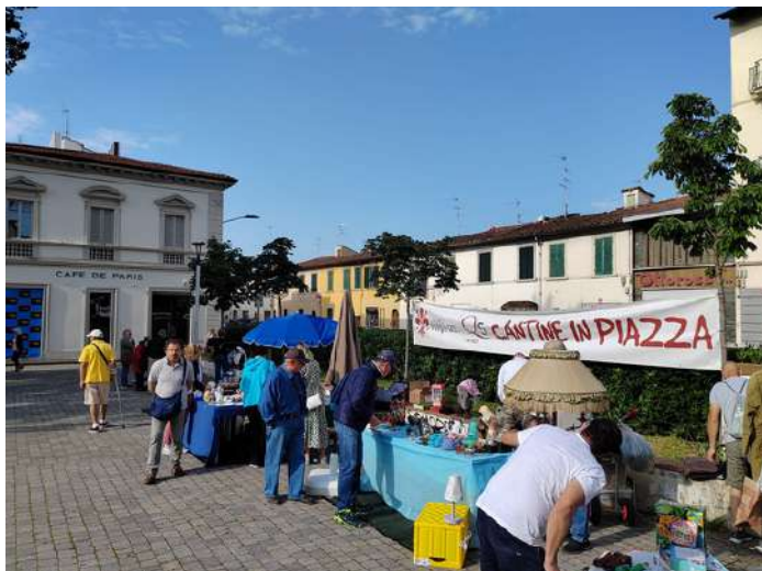
Cantine in Piazza