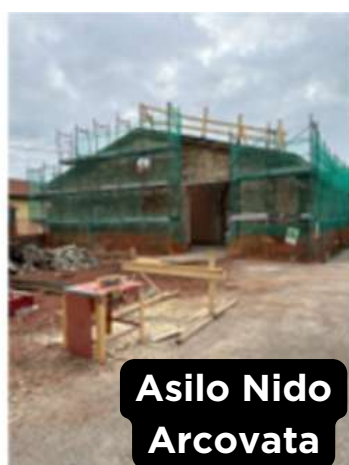
Asilo Nido Arcovata