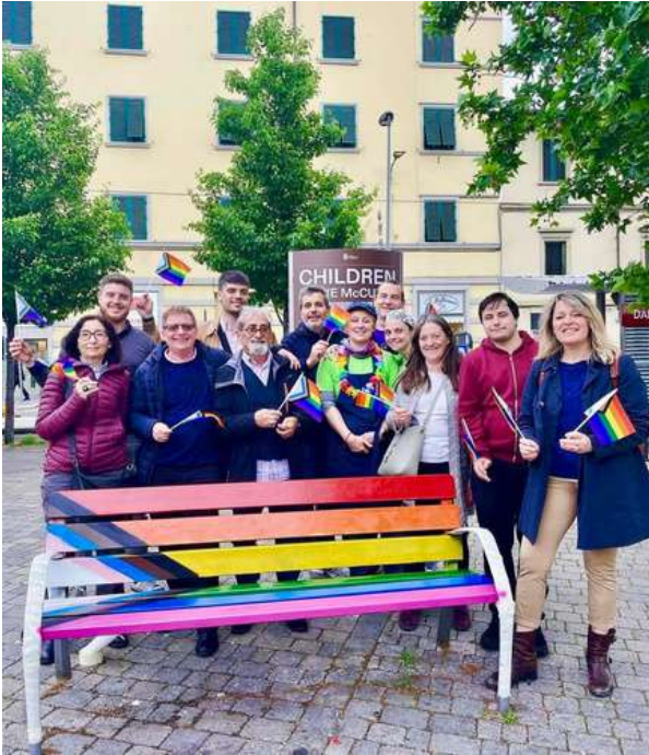
Panchina inclusiva presso Piazza Dalmazia