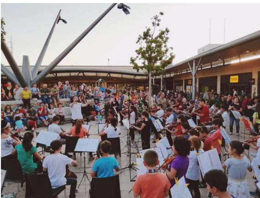
Il Concerto Progetto Orchestra Piagge