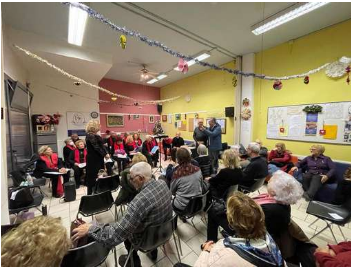
Attività nei centri dell'Età Libera