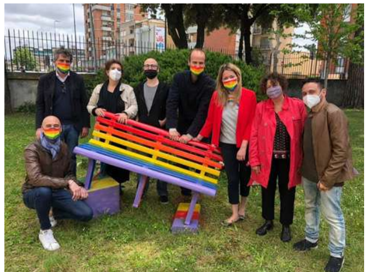
Panchina Arcobaleno contro le discriminazioni di genere presso Villa Pallini