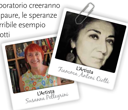
L'Artista Fiamma Antoni Ciotti