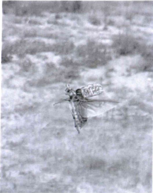
Allegato: Polyphylla fullo