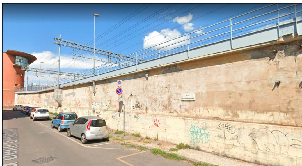
Tratta dove valutare compatibilità con spazi per street art